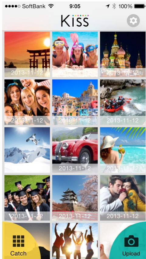
受信写真一覧画面