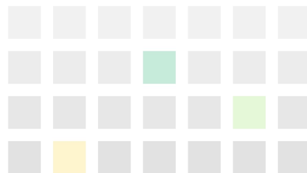
ランディングページ