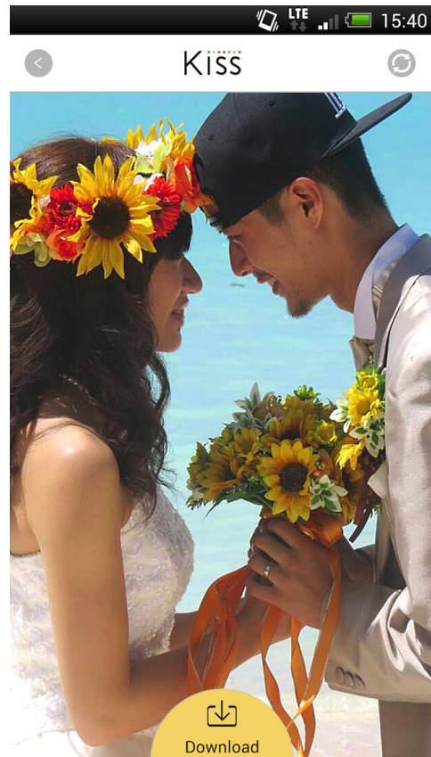
写真ダウンロード画面